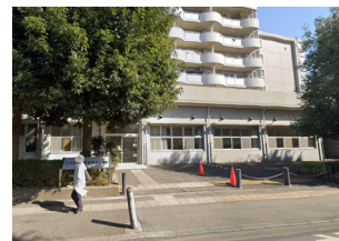
住所:小平市美園町1-19