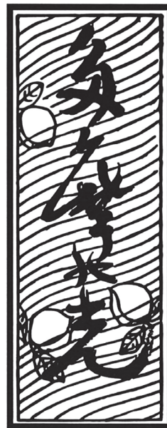
題字 谷口雅春先生 御揮毫

2年前にウクライナの平和を祈念して皆様に奉納していただき、教化部の住吉分社協に奉安されていた絵馬を焼却する御祭を執り行います。『人類同胞大調和六章経』をご持参ください。