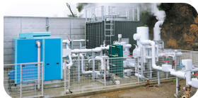
◀大分・別府 地熱発電所