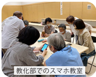
教化部でのスマホ教室

コロナ禍では対面の行事ができなくなり、インターネットの活用が飛躍的に進められました。そして、コロナ禍がおさまり対面の行事が再開されましたが、インターネットの活用はますます進められています。